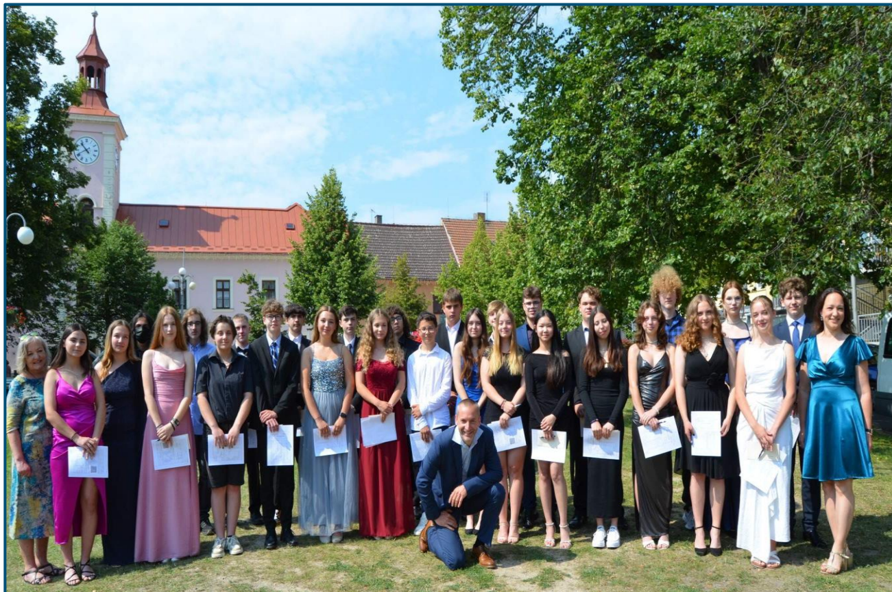
Slavnostní předávání vysvědčení žákům třídy 9. C