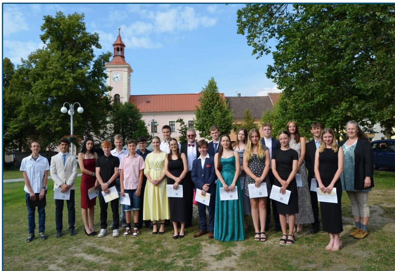
Slavnostní předávání vysvědčení žákům třídy 9. D