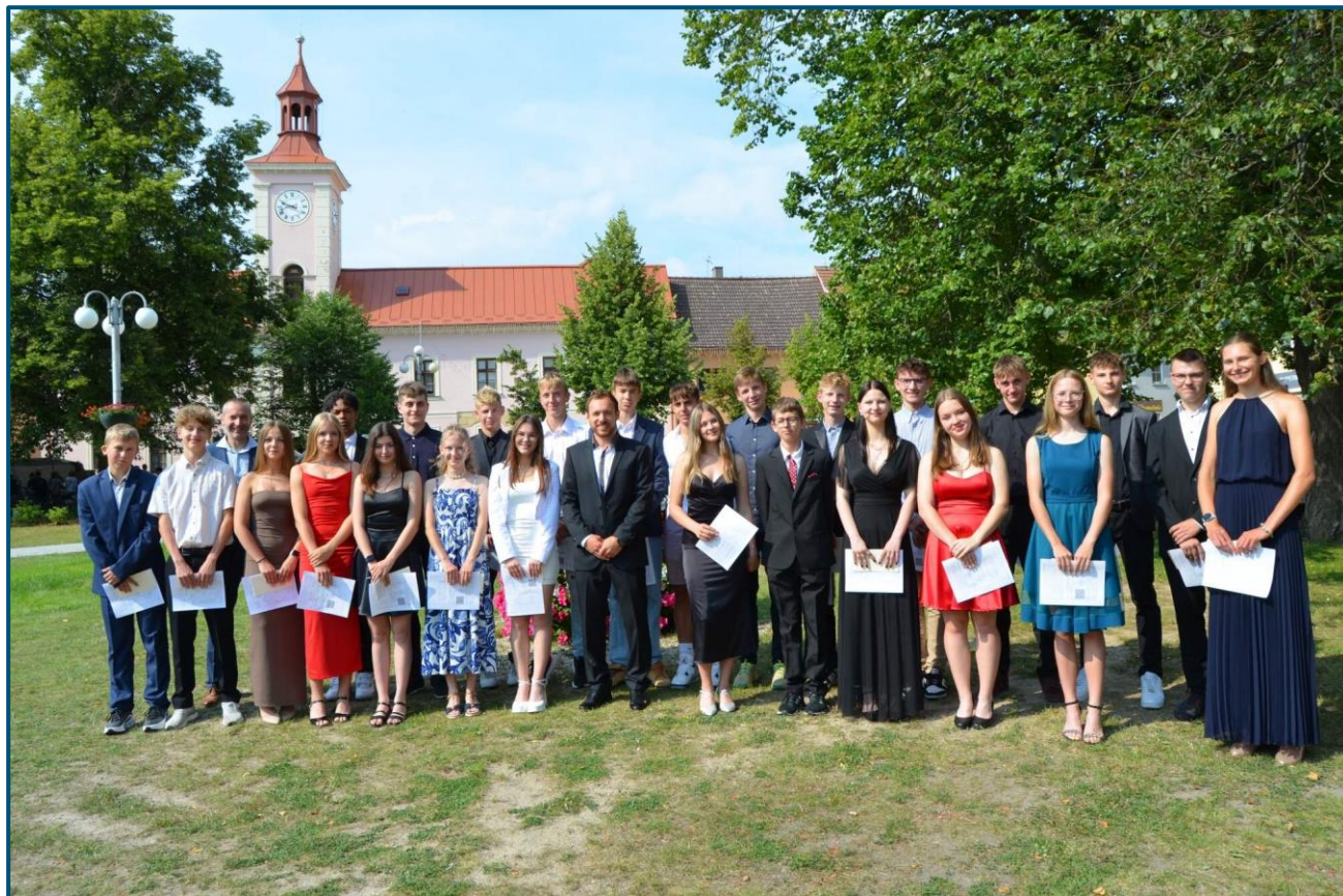
Slavnostní předávání vysvědčení žákům třídy 9. S