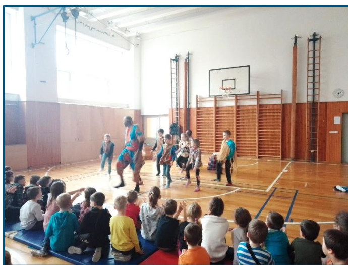
Činnost ve školní družině