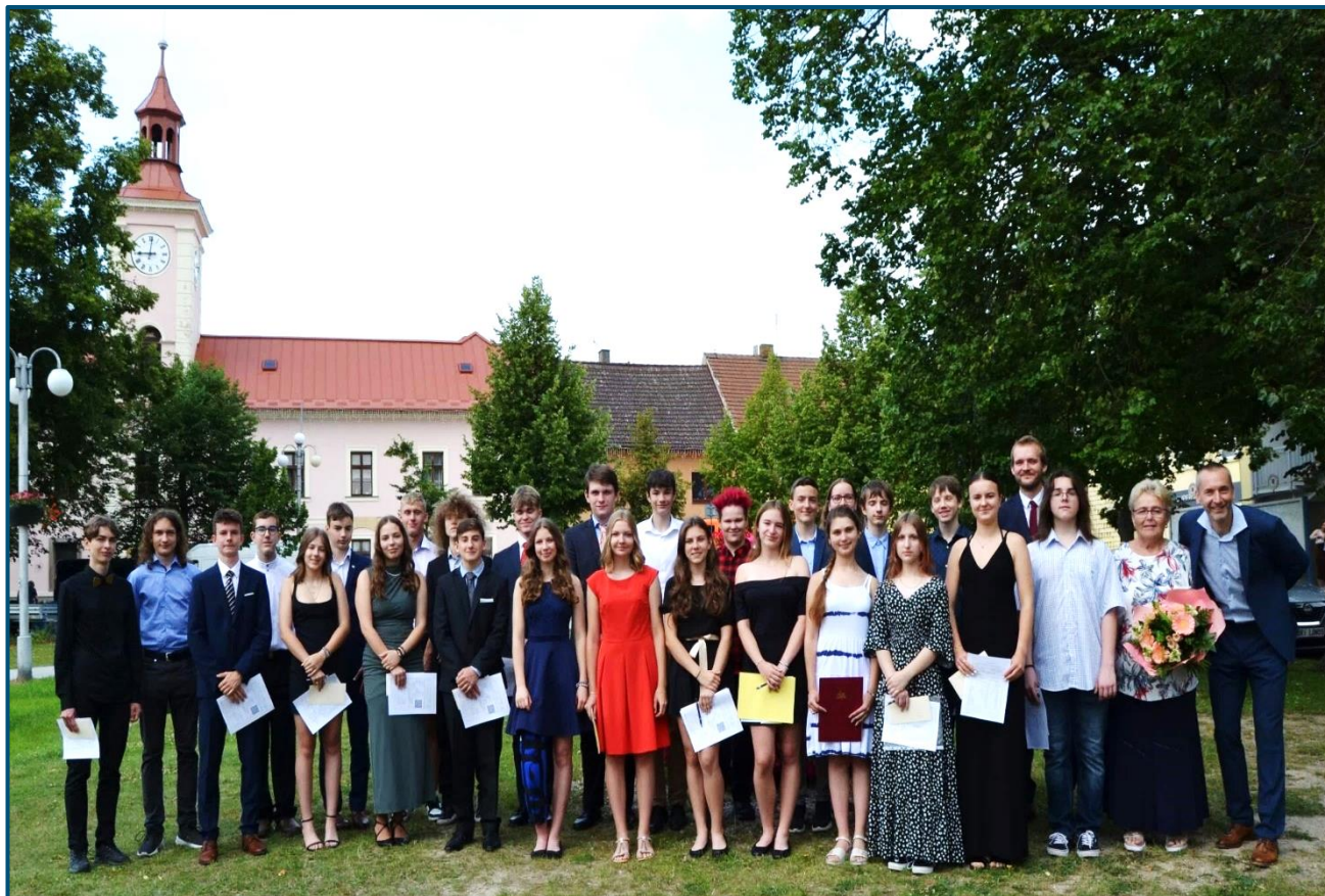
Slavnostní předávání vysvědčení žákům třídy 9. A